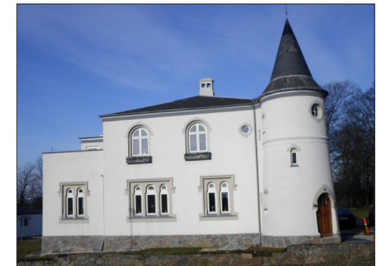
"Slottet" - Svingels Allé 2

Jo, Nakskov er ikke kun fordums storhed, men også fremskridt og kampen for en ny oplomstring.