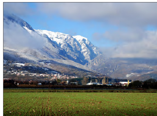
Bjergene rundt om Peja.