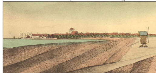
Nakskov fra Møllemarken ca. 1754.

Denne vækst i handel og økonomi forstærkedes i høj grad på samme tid, i og med at der langs den tyske Østersøkyst fra omkring 1200 opstod en række byer - eksempelvis Wismar, Rostock og Stralsund, der fra omkring 1250 sammen med Lübeck udviklede sig til Østersøregionens stærkeste handelsmagt med hensyn til køb og salg af varer. En voksende fjernhandel mellem Lolland-Falster og de nordtyske byer - populært kaldet hansestæderne - var dermed en realitet, hvor øernes bidrag til handelen