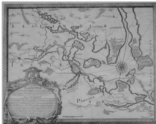
Nakskov afbildet af den svenske konges kartograf. Viser løbegrave fra en af belejringerne (1658/1659) set fra nord mod syd.

Af folketællinger fremgår det, at Nakskov allerede i 1672 havde 1.920 indbyggere. Til sammenligning er der ifølge Danmarks Statistik i 2015 12.665 indbyggere. Nakskov har således været en stor by dengang. Det kan den blive igen.